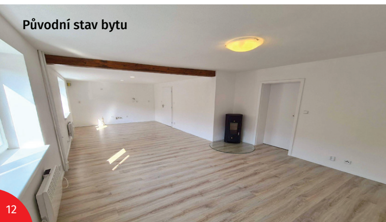
Původní stav bytu

Zároveň tento způsob prezentace klienty skvěle připraví na osobní prohlídku. Tento způsob prezentace je vhodný pro všechny typy nemovitostí. Ať už se jedná o velké či menší rodinné domy, byty, nebytové prostory, chaty či chalupy. Naprosto ideální je pak pro atypické prostory, které není jiným způsobem možné zaznamenat.