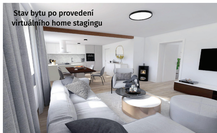
Stav bytu po provedení virtuálního home stagingu

Pro nemovitosti, které nejsou vybaveny nábytkem, doporučujeme využít virtuální home staging, který vdechne život prázdným stěnám a pomůže nemovitost prodat rychleji a za více peněz. Díky speciální metodě úpravy fotografií je možné zmodernizovat byt před rekonstrukcí nebo vybavit prázdnou místnost krásným interiérem. Kupující si díky tomu dokážou lépe představit možné budoucí využití prázdného prostoru.